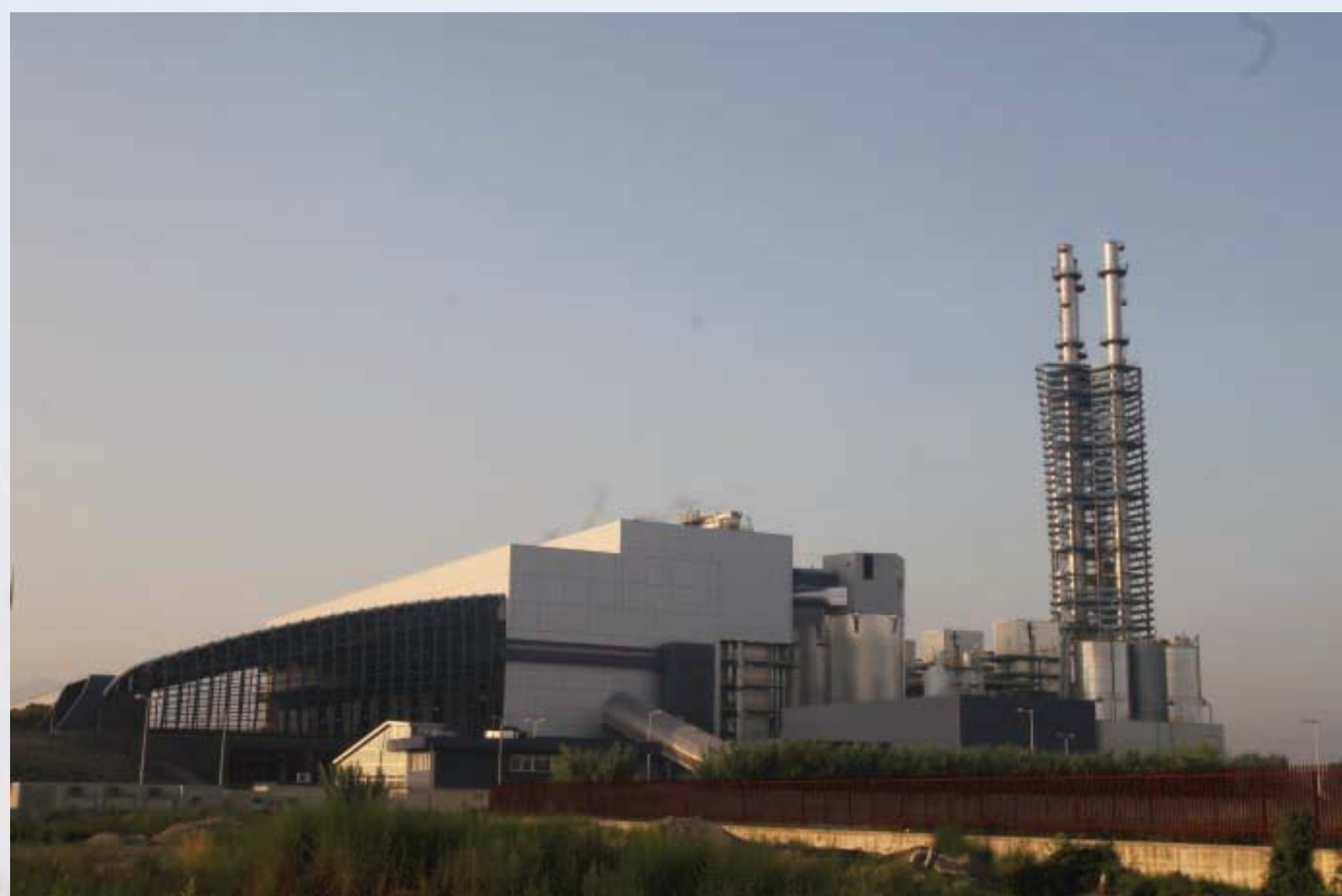
Ynni o Wastraff, Acerra, Naples - WRG Energy from Waste, Acerra, Naples - WRG

Ni fydd Asiantaeth yr Amgylchedd yn rhoi trwydded amgylcheddol os ydynt o'r farn y bydd cyfleuster Ynni o Wastraff yn achosi llygredd i'r amgylchedd, na niwed i iechyd cymunedau cyfagos.